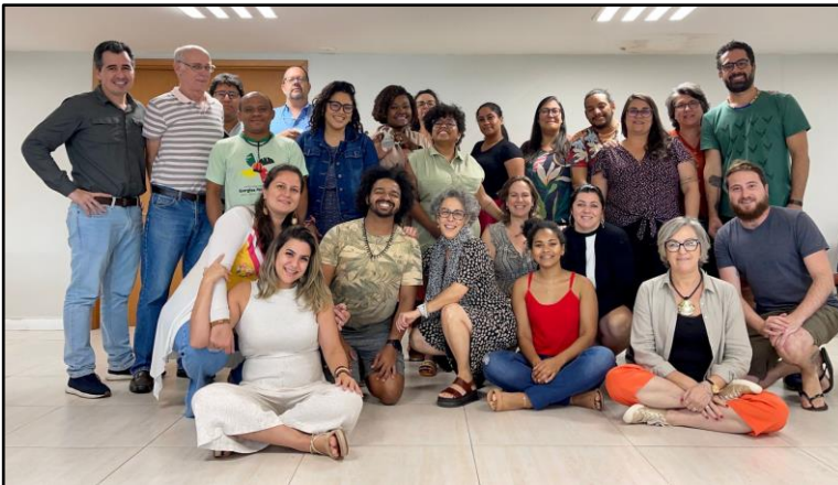
Reunión de Belém, Julio de 2022. Archivo Fondo Casa.

El día 27/07/2022 fue dedicado a la conversación entre los fondos de la Alianza Socioambiental Fondos del Sur, con la presencia de Perú, Ecuador, Colombia, Brasil y Bolivia. Tratamos de las bases filosóficas de los fondos socioambientales y el campo de la filantropía, gestión de acciones estratégicas, comunicaciones, gestión financiera y presentamos nuestras estructuras y proyectos en marcha.